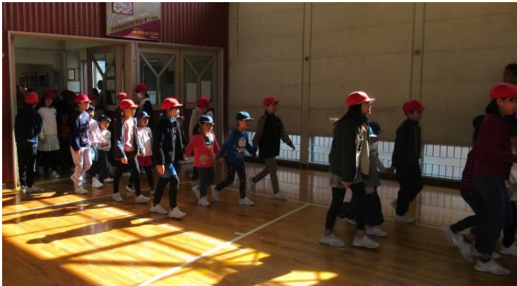
【6年生と手をつないで体育館に入場】